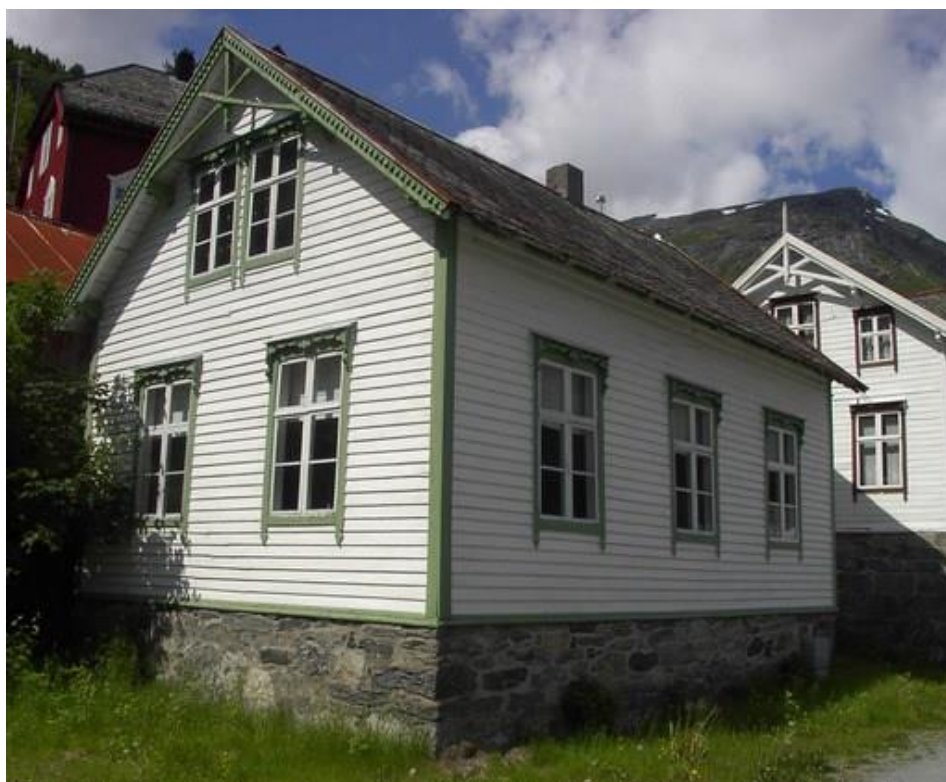
Hellesylt skule (1898-1956)