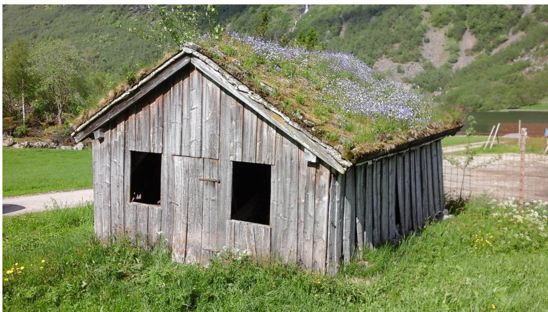
Smie i Knutgarden på Helset i Sunnylven.

I det gamle bondesamfunnet vart det meste laga heime på garden. Nokre produkt var likevel så avanserte at det var behov for å byte til seg varene, eller få hjelp av særskilt nevenyttige kvinner og menn. Dette var handverkarar som t.d. skomakarar, smedar og skreddarar.