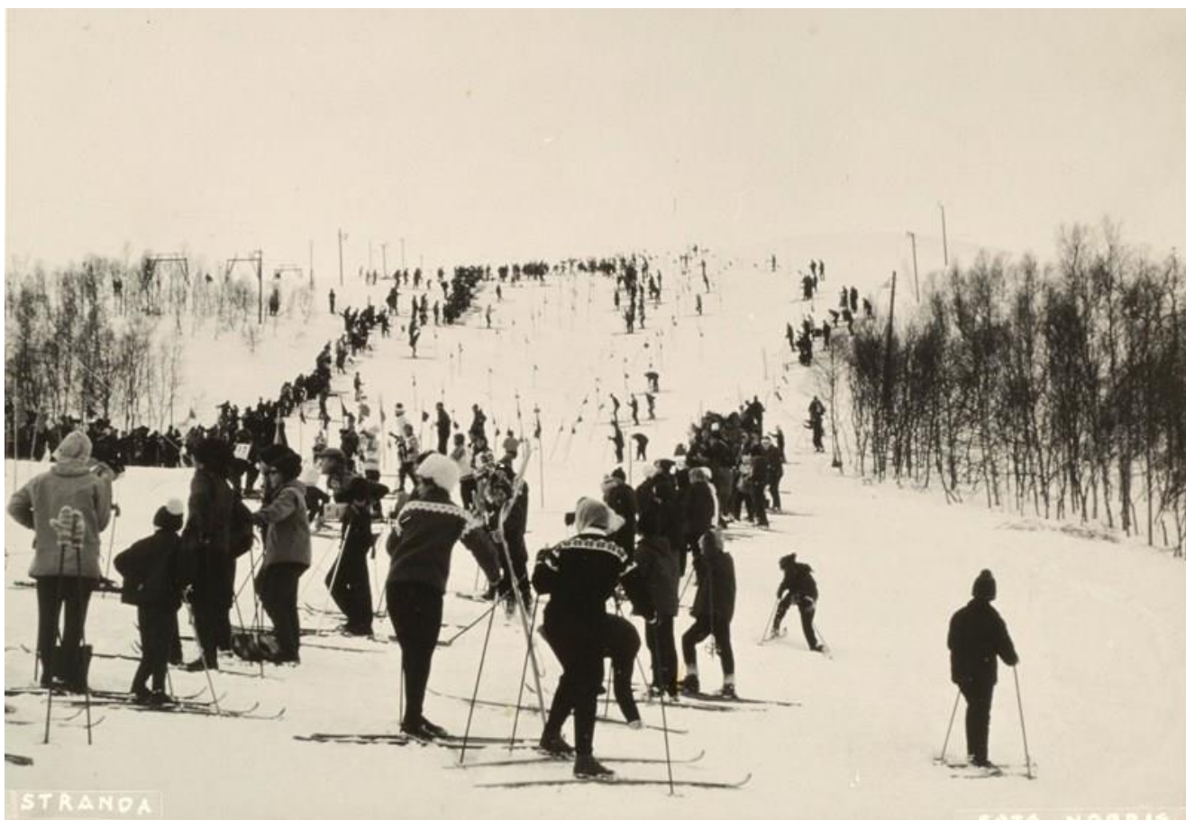
Skirenn på Strandafjellet ca. 1958