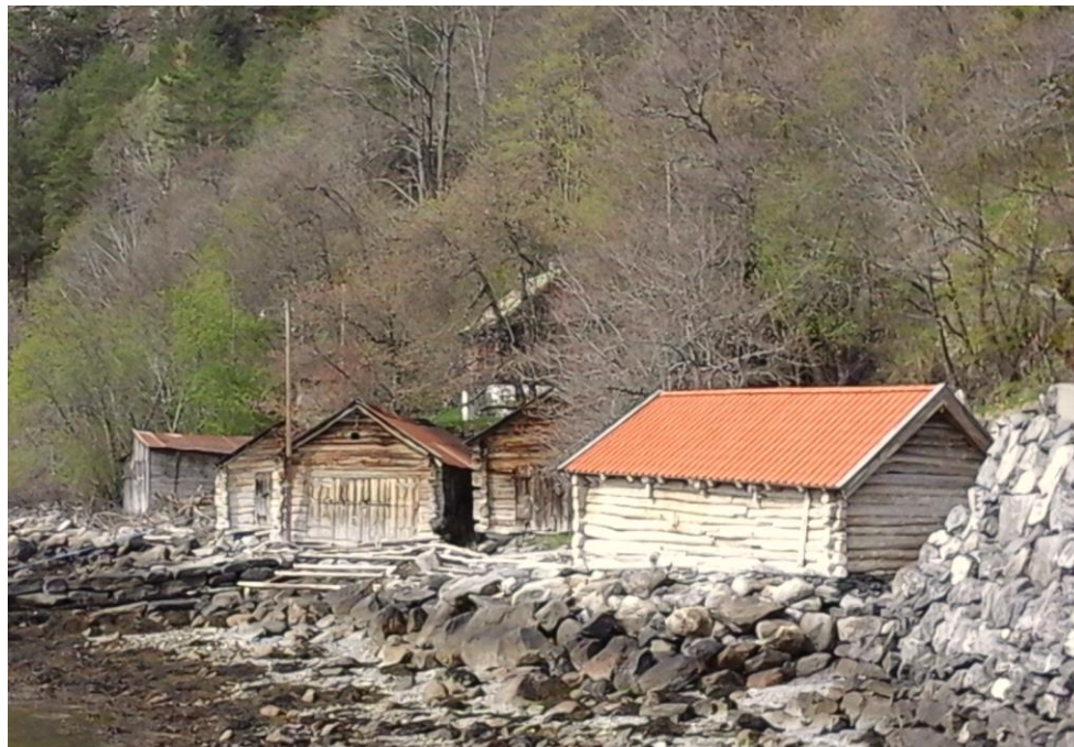
Naustrekka ved Liasjøen

I Stranda kommune er det 11 naustmiljø med til saman om lag 70 naust i varierende tilstand. Alt frå tidlege tider har folket i vår kommune ferdast på fjorden. Robåtar av alle slag har vore i bruk for å frakte folk, dyr og varer. Det har vore naudsynt å ha naust for å ta vare på båtane. Dei nausta som no står att, er verdfulle kulturmiljø, som vi må stimulere eigarane til å halde i stand.