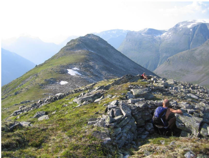
Bogestillingar på Vinsåshornet.