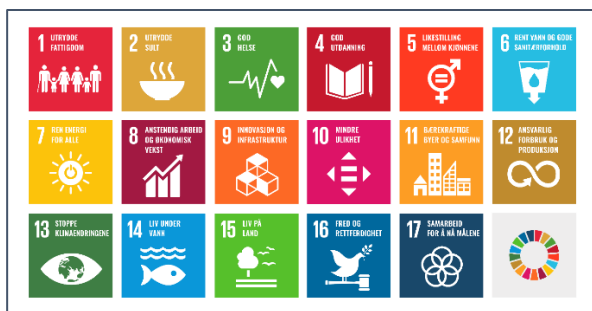
Figur 2. FNs bærekraftsmål er verdens felles arbeidsplan fordelt over 17 målområder for å utrydde fattigdom, bekjempe ulikhet og stoppe klimaendringene innen 2030.

Regjeringen har bestemt at FNs 17 bærekraftsmål, som Norge har sluttet seg til, skal være det politiske hovedsporet for å ta tak i vår tids største utfordringer, også i Norge. Det er derfor viktig at bærekraftmålene blir en del av grunnlaget for samfunns- og arealplanleggingen. Våren 2020 ble det klart at regjeringen skal lage en nasjonal handlingsplan for målene. Dette er viktig fordi de 17 bærekraftmålene henger tett sammen. Det er også nødvendig med en god plan for hvordan målene kan oppnås på tvers av politiske skillelinjer og i samarbeid med organisasjoner og kommuner.